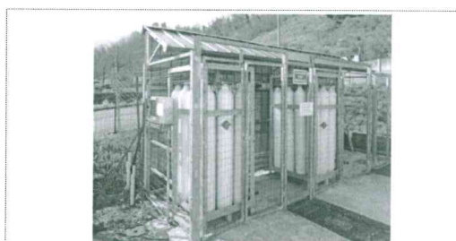
Deposito gas medicinali